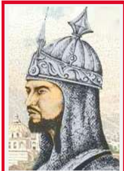
هوتکي شاه اشرف

کله چې شاه محمود په اصفهان کې مړ سو ، شاه اشرف د يوې جرگې د جوړېدو په ترڅ کې په اصفهان کې پاچا سو . شاه اشرف د عبدالعزیز زوی او د حاجي مير ويس خان وراره وو . دی يو ډېر هونبیار سړی وو . د ده لوی افسران سيدال خان نصري ، بابو جان بابی او ځیني نور وه .