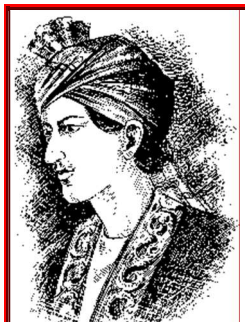
هوتکي شاه حسين

په کندهار کي چي د هوتکي پاچاهي مرکز وو د حاجي ميرويس خان کشر زوی شاه حسين پاته وو. کله چي شاه محمود د اصفهان پر لور لښکر کښي وکړه او هغه ځای ئې و نيوی (۱۱۳۵ هـ ق) نو د کندهار چاري ئې شاه حسين ته پرې بنودلې. شاه حسين يو علم پالونکی پاچا وو. د ده دوره په لومړي سر کي ډېره په آرامي تېره سوه دربار ئې له پوهانو، شاعرانو او د ادب له خاوندانو ډک وو. د ده په غوښتنه د ده په دربار کي پټه خزانه د محمد هوتک له خوا و ليکل سوه. پټه خزانه