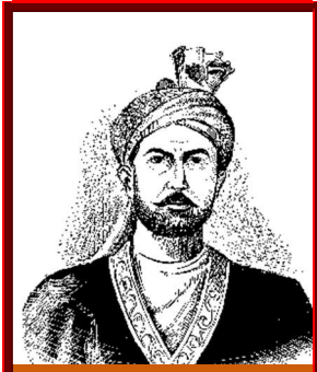
حاجي ميرويس خان

حاجي ميرويس خان نيکه د بنالم خان زوی او په قوم هوتک وو. پلار ئې د هوتکو مشر وو. د پلار تر مرگ وروسته حاجي ميرويس خان د قوم مشر توب پر غاړه واخيست. دی د هوتکو له مشرانو څخه يو نوميالی مشر وو. مير ويس خان درې وروڼه درلودل چي نومونه ئې عبدالعزيز خان، عبدالقادر خان او يحيی خان ول. په دوی کي ميرويس خان و کولای سواي چي د قوم مشر توب پر غاړه واخلي.