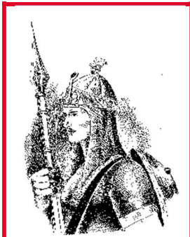
هوتکي شاه محمود

شاه محمود د حاجي ميرويس خان زوی وو. د پلار تر مرگ وروسته او د خپل تره عبدالعزیز خان د له منځه تلو وروسته پاچا سو.