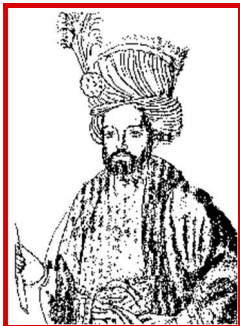
صفوي شاه حسين

ئې صفوي شاه حسين وو) له خوا تېری سوی وو. زموږ د هيواد د کندهار په ښار کي د صفوي دولت د لښکرو مشر (گورگين) حکمراني کوله او د دې ښار پر خلکو ئې ظلمونه کول.